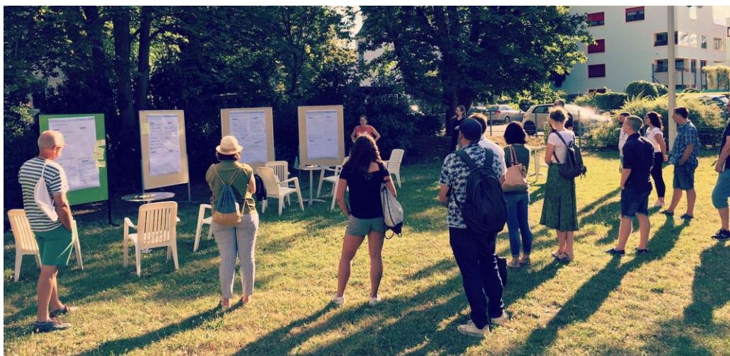
Bürgerworkshop zum ISEK Zukunft Gustavsburg, ProjektStadt 2020

In diesem Sinne erwartet die Stadt Ginsheim-Gustavsburg noch weitere, anregungsvolle Ideen ihrer Bürgerinnen und Bürger für die Zukunft von Gustavsburg. Die Beteiligungsplattform wird bis zum 17.09.2020 verfügbar sein und ist unter https://www.zukunft-gustavsburg.de abrufbar.