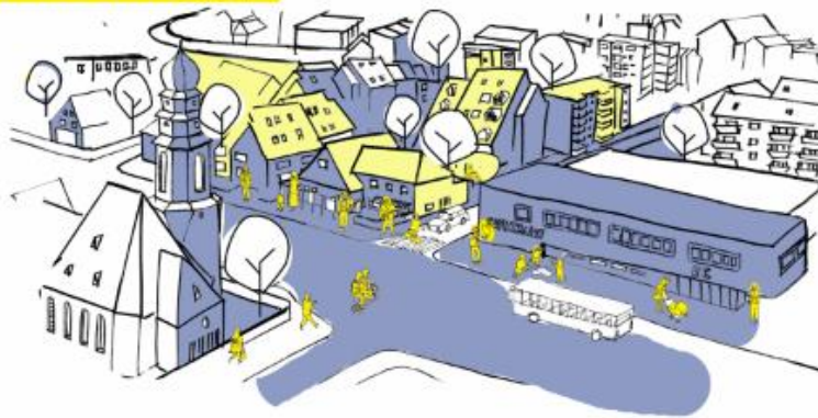
Illustration der Stadt Ginsheim-Gustavsburg, ProjektStadt 2020