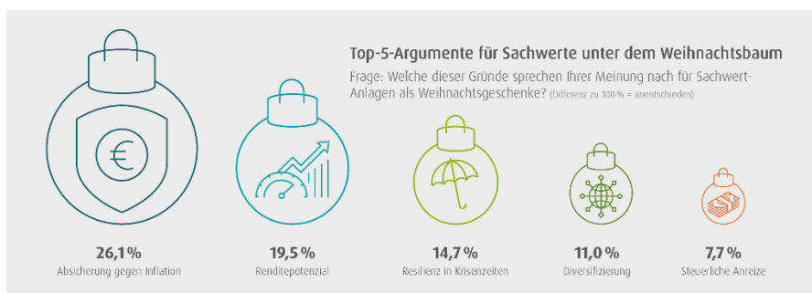
Abbildung 3: Frage: Welche dieser Gründe sprechen Ihrer Meinung nach für Sachwertanlagen als Weihnachtsgeschenke? (Differenz zu 100 % = unentschieden)

Auf die Frage, welche Gründe für eine Sachwertanlage als Weihnachtsgeschenk sprechen, nannte mehr als ein Viertel (26,1 %) eine Absicherung gegen Inflation als Top-Argument. Knapp ein Fünftel der Investoren (19,5 %) erachtet zudem das Renditepotenzial als guten Grund, Sachwerte unter den Weihnachtsbaum zu legen. Außerdem wurden Resilienz in Krisenzeiten (14,7 %), Diversifizierung (11,0 %) sowie steuerliche Anreize (7,7 %) angegeben.