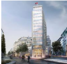
Springer Quartier Hamburg